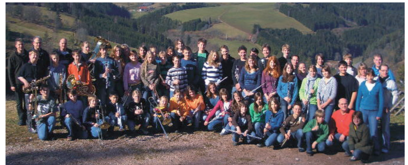
Probewochenende der Jugendkapelle 2007