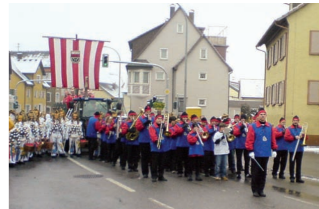
Fasnet in Spaichingen