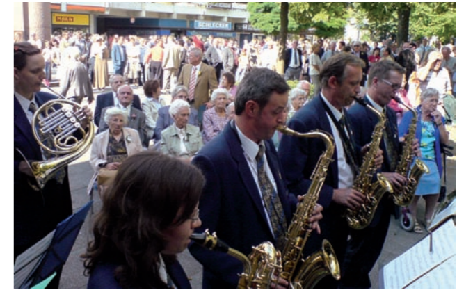
Platzkonzert anlässlich des 50er-Festes