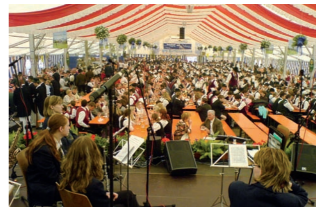
Festzeltauftitt in Bayern