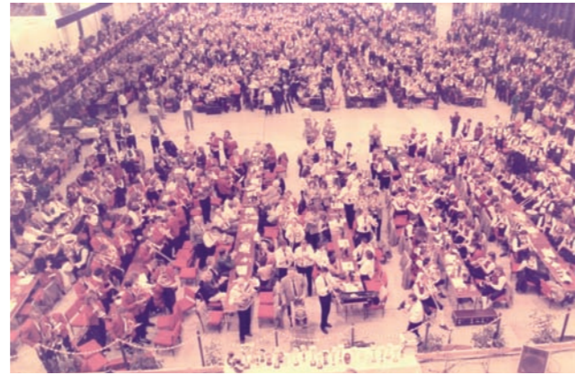
Preisträger internationales Wertungsspiel in Brünn (Tschechien)