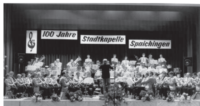
Jubiläumskonzert 1986, 100 Jahre Stadtkapelle Spaichingen

Die Stadtkapelle ist ein Hauptbestandteil des Spaichinger Kulturlebens und aus diesem nicht mehr wegzudenken. Der musikalische Höhepunkt jedes Jahres ist das Herbstkonzert. Von Bearbeitungen klassischer Meister und Original-Blasmusikkompositionen über Werke der modernen Unterhaltungsmusik bis hin zu traditionellen Märschen reicht hier die musikalische Bandbreite.