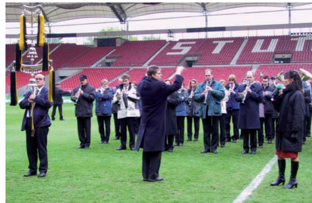
Fußball-Länderspiel Deutschland – Argentinien Probe mit Anna Maria Kaufmann