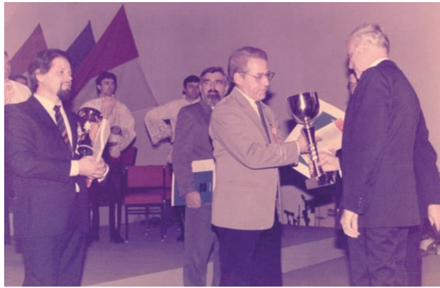
Preisträger internationales Wertungsspiel in Brünn (Tschechien)