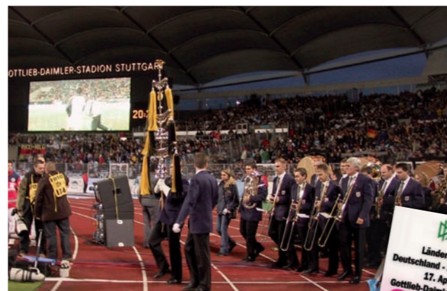
Fußball-Länderspiel Deutschland – Argentinien