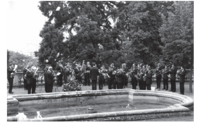
Auftritt in der Villa Reitzenstein in Stuttgart