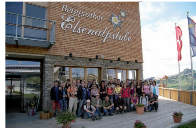
Ausflug nach Damüls 2009