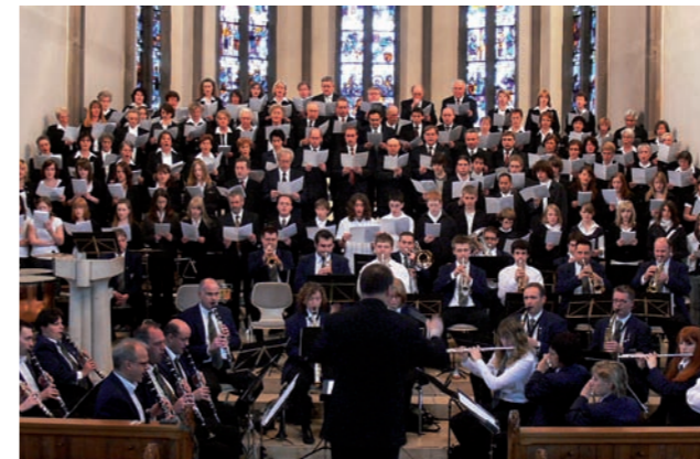
Kirchenkonzert mit kath. Kirchenchor Spaichingen