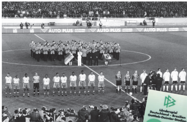
Fußball-Länderspiel Deutschland – Brasilien