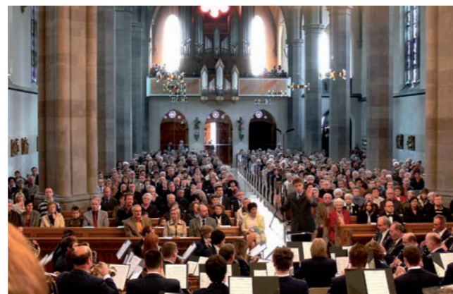
Meßbegleitung 3. Advent