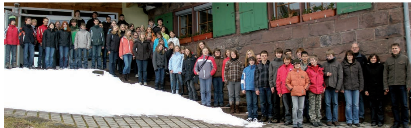
Probewochenende der Jugendkapelle 2009

Postfach 1107 78549 Spaichingen Tel: 07424/905941 E-Mail: info@primtalmusikschule.de