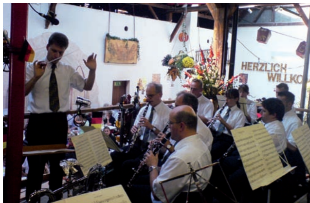
Frühschoppen in Strümpfelbach